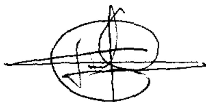
ILDEVAR PRANDO Prefeito Municipal

Prefeitura Municipal de Governador Lindenberg - Estado do Espírito Santo, aos 14 (quatorze) dias do mês de abril do ano de dois mil e quatro (2004).